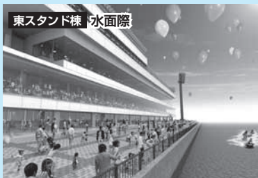
東スタンド棟 水面際