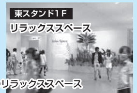
東スタンド1F リラックススペース