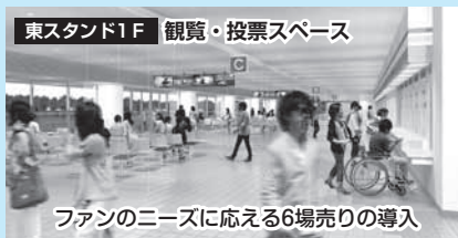
東スタンド1F 観覧・投票スペース