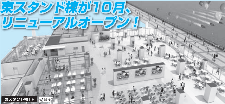
東スタンド棟1F フロア

ボートレース若松では現在東スタンド棟の全面リニューアルを行っています。「観戦環境の充実」、「食やイベントスペースの拡充」、「女性専用リラクスペースの新設」など、ご来場の皆様にとって快適で楽しんでいただける空間作りに取り組んでいます。この秋、新しく生まれ変わるボートレース若松に、ぜひご期待ください。