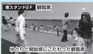
東スタンド2F 観覧席