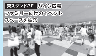
東スタンド2F バイン広場