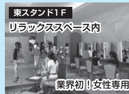
東スタンド1F リラックススペース内