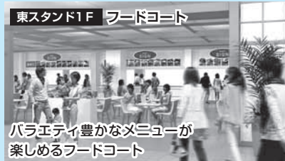
東スタンド1F フードコート